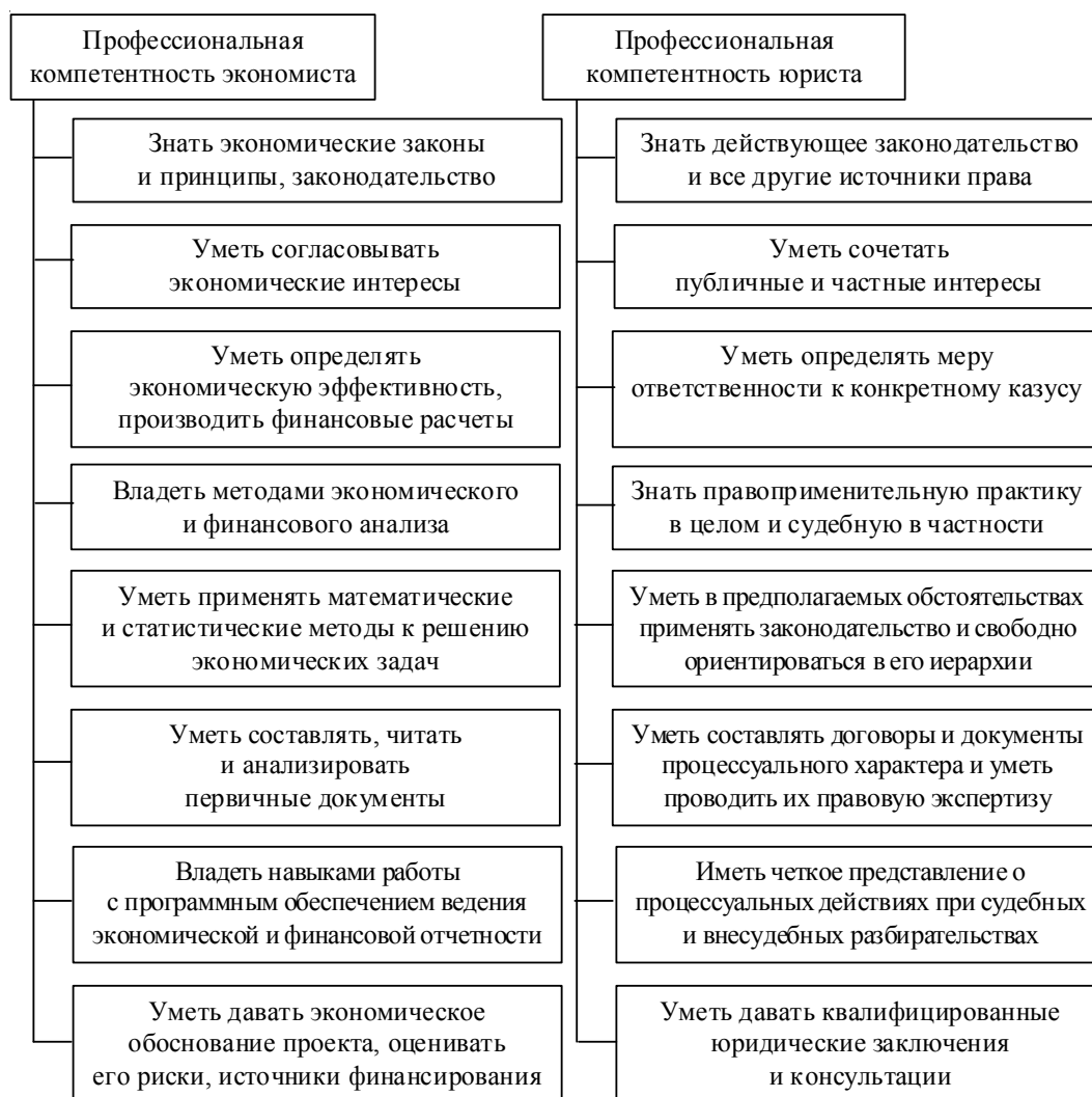
Рис. 2. Сравнительная характеристика профессиональных компетенций студентов-выпускников экономических и юридических специальностей

сии было проведено анкетирование выпускников с целью определить, какие профессиональные качества (компетенции) востребованы на рынке труда. В анкетировании приняли участие четыре государственных вуза России: Волгоградский государственный университет и три педагогических вуза Московской области. Как показали результаты анализа, знания по специальности не являются единственной компетенцией, востребованной на работе. Около десятка других компетенций получили более высокие коэффициенты значимости: аналитическое мышление, умение быстро осваивать новую информацию, вести переговоры, работать в стрессовой ситуации, эффективно использовать рабочее время, работать в группе, грамотно выражать свои мысли, ук-